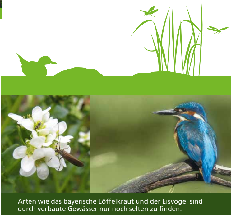
Arten wie das bayerische Löffelkraut und der Eisvogel sind durch verbaute Gewässer nur noch selten zu finden.

Wasser ist eine unverzichtbare Lebensgrundlage für Menschen, Tiere und Pflanzen. Ein guter Zustand unserer Bäche und Flüsse ist deshalb ein wichtiges Ziel bayerischer und europäischer Umweltpolitik. Die Europäische Wasserrahmenrichtlinie und das bayerische Wassergesetz schaffen hierfür den rechtsverbindlichen Rahmen. Sie geben vor, dass mit Verlängerung spätestens bis zum Jahr 2027 alle Gewässer in einem guten Zustand sein müssen.